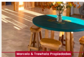
Marcelo & Trewela Propiedades