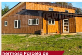
hermosa Parcela de