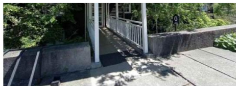
ACCESO EDIFICIO G